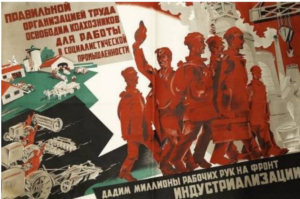
Плакат А. Радакова.

Задачи ударничества были определены в постановлении ЦК ВКП(б) от 28 апреля 1930 г.: «Основной целью ударного движения является, наряду с повышением интенсивности труда, всемерное улучшение всего процесса производства: лучшая организация труда, рационализация производства и управления, максимальное развитие изобретательства, внедрение культурных навыков в производстве».