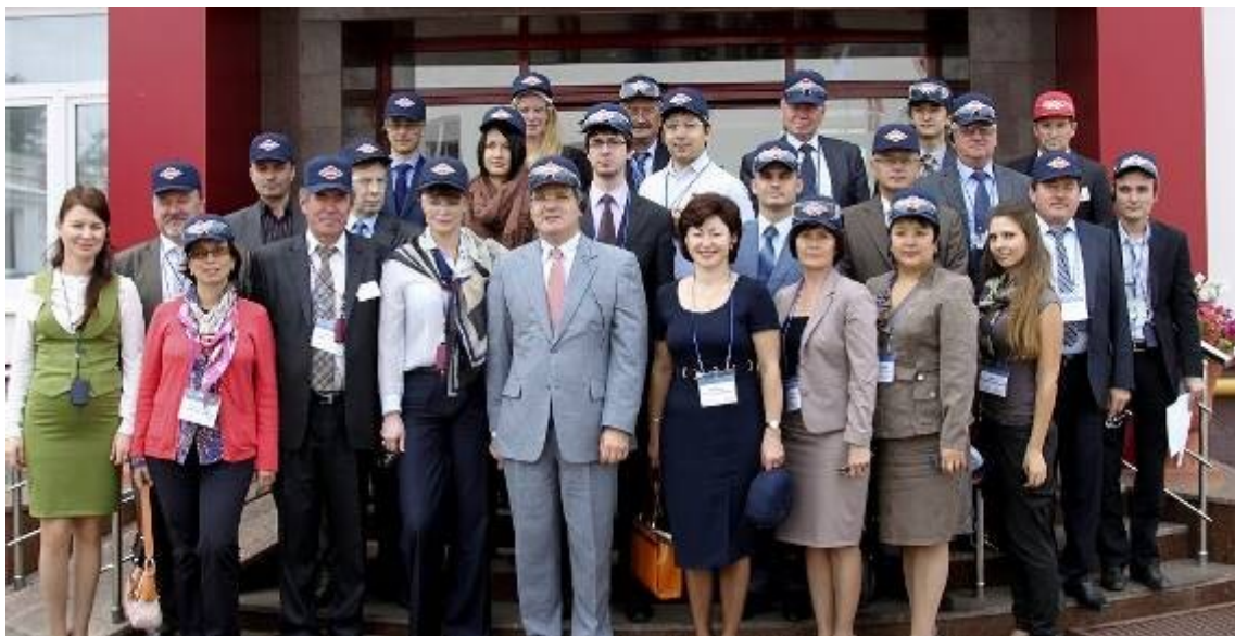
Участники семинара «Европейская социальная хартия» в НПФ «Пакер»