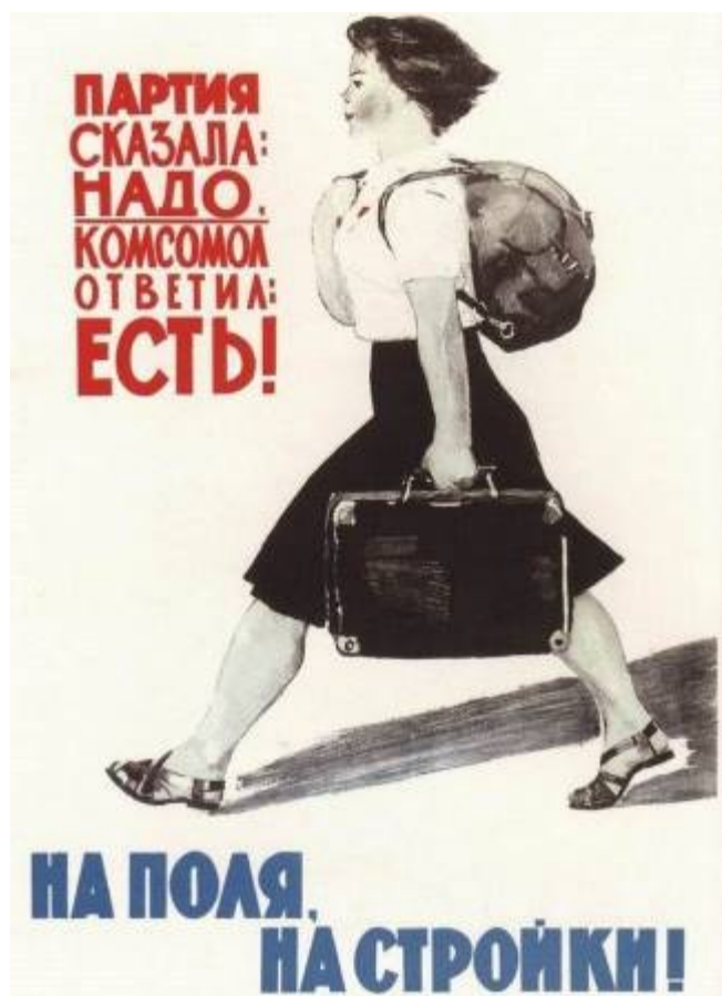
Плакат И. Большакова, В. Смирнова

Трудовой энтузиазм, подкрепленный мощной идеологической основой, не оставлял времени остановиться, оглядеться, задуматься. Как же – строим новый завод и новую жизнь, готовы терпеть временные неудобства, но работать столько, сколько надо, брать высокие обязательства к знаменательным датам и съездам партии и перевыполнять их. Трудовые будни отражали героические поступки. Стране нужны были КАМАЗы, чем больше, тем лучше. И она получала их. С каждым годом всё больше и больше. И это было главным: «КАМАЗ» спасал транспортную систему страны, а с ней и всю её экономику.