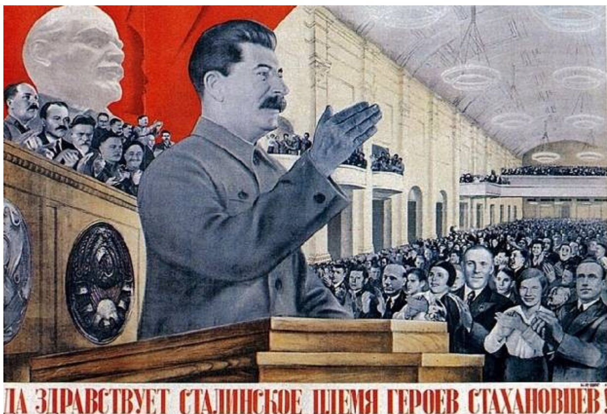
Г. Клуцис. Плакат «Да здравствует сталинское племя героев стахановцев!»

Как отмечалось в докладе, стахановцы - это новаторы в промышленности. А само стахановское движение ломает все старые взгляды на технику и людей, технические нормы, проектные мощности и производственные планы. Оно выражает новый подъем социалистического соревнования, открывает путь, на котором можно добиться высших показателей производительности труда, которые необходимы для перехода от социализма к коммунизму. Именно на том совещании Сталин произнес свою крылатую фразу: «Жить стало лучше, товарищи. Жить стало веселее».