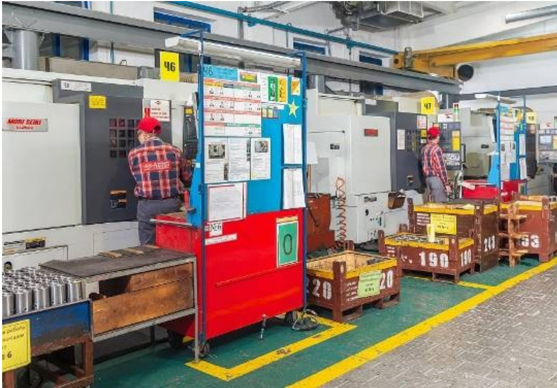
Рабочее место оператора станка с ЧПУ

бережливого производства как Упорядочение/5S - систему организации и рационализации рабочего места; TPM - систему всеобщего производительного обслуживания оборудования и Бережливый офис – современную управленческую технологию для офисных работников.