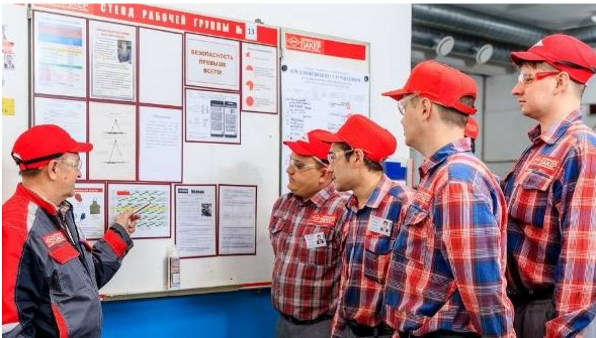
Совещание малой рабочей группы на производстве

- Те, люди, которым мы рекомендовали приехать на «Пакер» и посмотреть как достаточно твердо компания стоит на ногах, как внедряет современные организационные инновации, возвращаясь восклицали: «Да, а чего же вы хотите? Там и собственник и руководитель в одном лице. В этом и весь успех». А мы неизменно отвечали: конечно, это так, но для этого нужно ещё активно и грамотно использовать весь личный менеджерский ресурс руководителя.