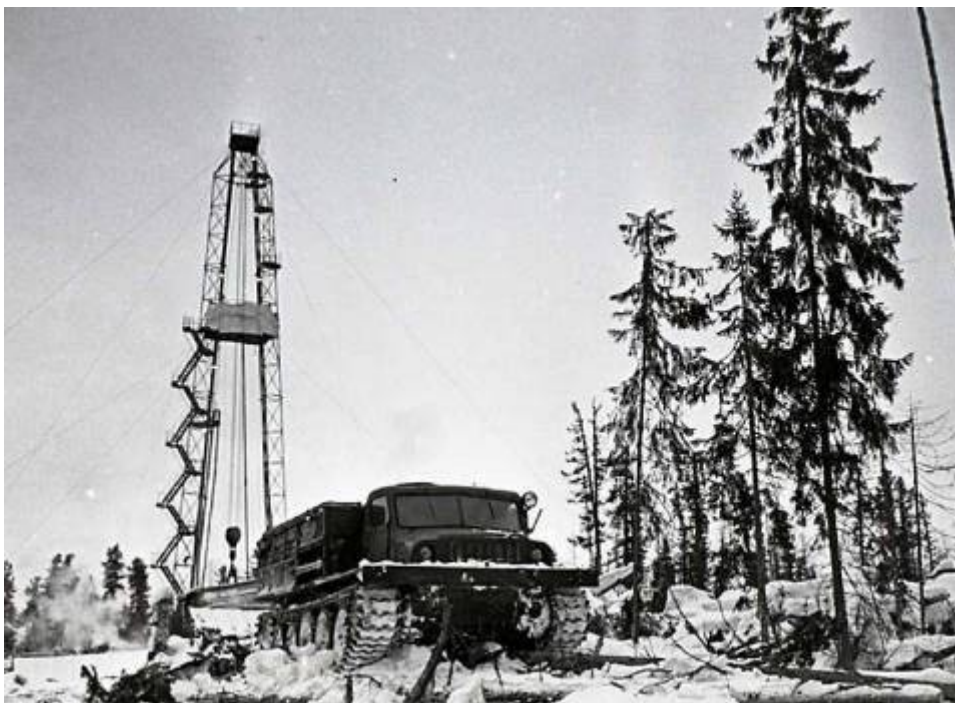
Начало большой нефти в Западной Сибири: буровая в тайге

С конца 70-х годов Советский Союз выходит на первую позицию по добыче нефти в мире, а во второй половине 80-х на месторождениях Западной Сибири был установлен рекордный результат – ежегодная добыча углеводородов превысила 624 миллиона тонн. Но стремление к максимальным результатам при минимальных издержках с помощью доминирующей технологии накачивания воды в нефтяные скважины быстро привело к спаду добычи. К концу 80-х годов в значительной степени были выработаны крупные и высокодебитные месторождения. Начала остро ощущаться потребность в новых технологиях нефтедобычи и, соответственно, в высокопроизводительной технике и оборудовании. Картина была безрадостная: основная часть технических средств имела износ более 50 процентов, только 14 процентов машин и оборудования соответствовали мировым стандартам, а 70 процентов парка буровых установок вообще морально устарело и требовало замены.